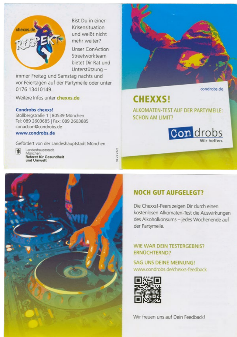
■ Flyer „Chexxs!“ – A-2021/3.1

Alkoholkonsum sensibilisiert. Das Peer-to-Peer-Projekt engagiert pro Nacht zwei junge Erwachsene, oftmals Studierende der Sozialen Arbeit, die auf der Feiermeile patrouillieren und Alkoholtests durchführen. Selbst auf Nachfrage geben sie sich nicht als Sozialarbeiter*innen zu erkennen, was den Eindruck von Nähe zur Zielgruppe erhöhen soll. „Chexxs!“ will zum Nachdenken anregen, solange die Kompetenz zur Selbstkontrolle noch gegeben scheint. Es werden nur Personen angesprochen, die nicht stark alkoholisiert wirken. Sofern die Partygänger*innen ihre Blutalkoholkonzentration niedriger einschätzen als es der Test angibt, werden auch Empfehlungen ausgesprochen,