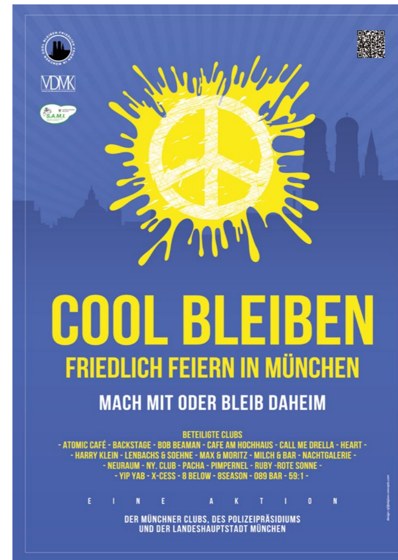
■ Plakat „Cool bleiben“, 2012 – Alexander Fatseas, © Verband der Münchener Kulturveranstalter e.V.

Aus den Sitzungen des „Sicherheits- und Aktionsbündnis Münchner Institutionen“ (S.A.M.I.), einem Arbeitskreis des KVR, des Polizeipräsidiums und weiteren Behörden, ging schließlich das Projekt „Cool bleiben“ hervor. Im Rahmen dieser Kooperation arbeitet das Polizeipräsidium mit den genannten Referaten und den Wirt*innen der Feiermeile zusammen, um gemeinsam und koordiniert einen Rückgang der Gewaltdelikte zu bewirken. Dadurch ist ein ganzes Bündel an Maßnahmen möglich geworden: Die zentrale Sanktion der Kampagne sind hoheitliche Betretungsverbote, die für den Bereich der Feiermeile ausgesprochen werden können. Wenn ein sogenanntes Rohheitsdelikt begangen wird – „zum Beispiel gefährliche Körperverletzung, Raub, Bedrohung,