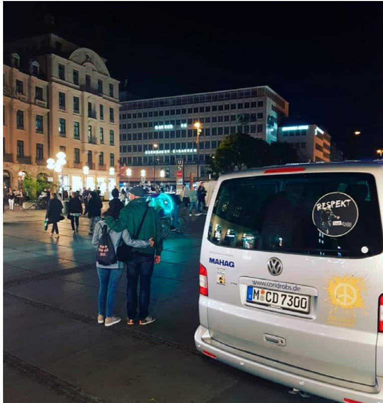
■ Fotografie, Einsatzbus des Projektes „Streetwork auf der Partymeile“ am Stachus, 2018