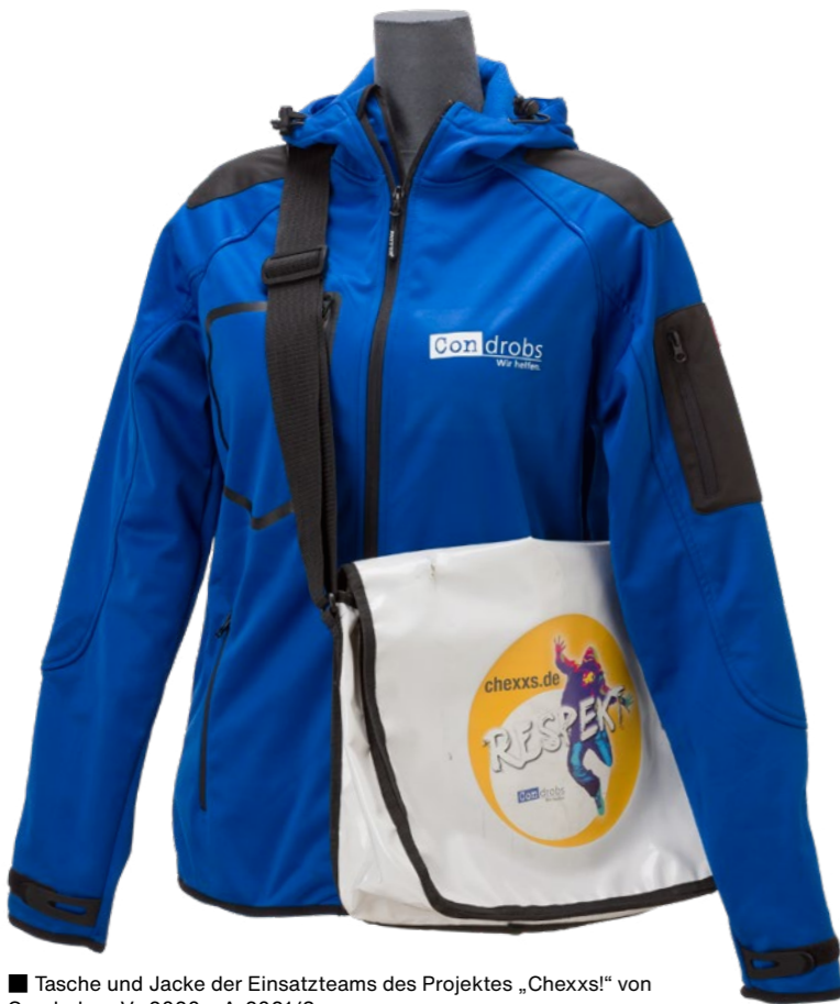
■ Tasche und Jacke der Einsatzteams des Projektes „Chexxs!“ von Condrobs e.V., 2020 – A-2021/3